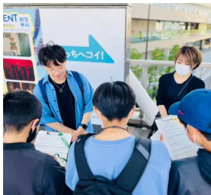
アンケート実施の様子

設問2 「憲法は変えるべきか？」 という問いに対して、改憲賛成（変えるべき、どちらかといえば変えるべき）の回答数が16人（15・4%）に対して、改憲反対（変えるべきでない、どちらかといえば変えるべきでない）の回答数が22人（21・2%）と上回った。ただし、「わからない」と回答した若者が66人（63・5%）と相変わらず多数を占めた。