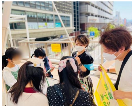
アンケート実施の様子

述が26件と多数を占めた。憲法9条が変えられることが戦争につながるのではないかと不安と、9条によって平和が守られてきたという認識が強かった